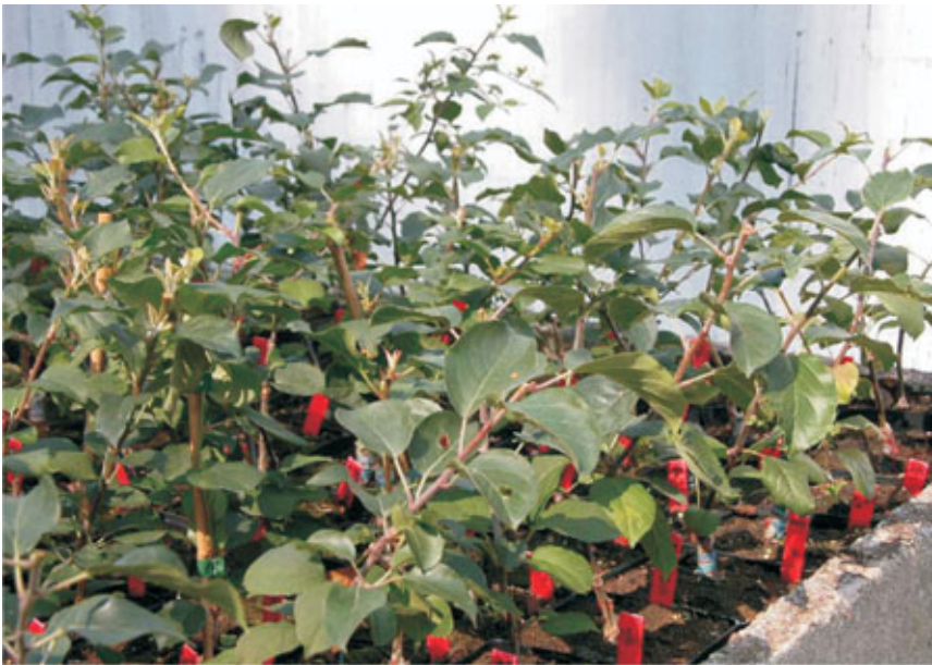
Enten van wilde appel, vermeerderd ter bewaring en bescherming van deze uiterst zeldzame boomsoort.

Voor sommige soorten zijn de autochtone individuen zo zeldzaam dat een vegetatieve vermeerdering van de resterende individuen zich opdringt. Via aanplantingen met deze stekken of enten kunnen we zo op zijn minst de genetische diversiteit van deze relictten bewaren (= genenbank). Het INBO legt genenbanken aan van onder andere zwarte populier, wilde appel, verschillende wilde rozen, wegedoorn en fladderiep.