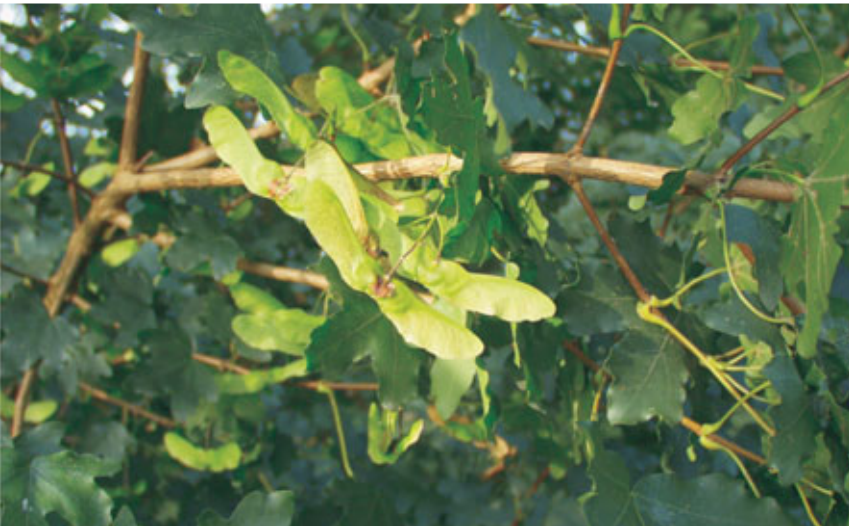
Gevleugeld zaad van veldesdoorn.

Autochtoon plantsoen gecertificeerd onder de categorie 'van bekende origine' is nog niet beoordeeld op economische kwaliteit. Als je kwaliteitshout wil produceren gebruik je best plantsoen met een herkomst van de categorie 'geselecteerd' of hoger, en dat op de lijst van aanbevolen herkomsten staat. Deze zijn uitgekozen op basis van ecologische aspecten, vitaliteit en economische kwaliteit. Daarnaast weet elke bosbouwer dat de kwaliteit van de bomen niet enkel van de herkomst maar ook sterk van het beheer afhankelijk is.