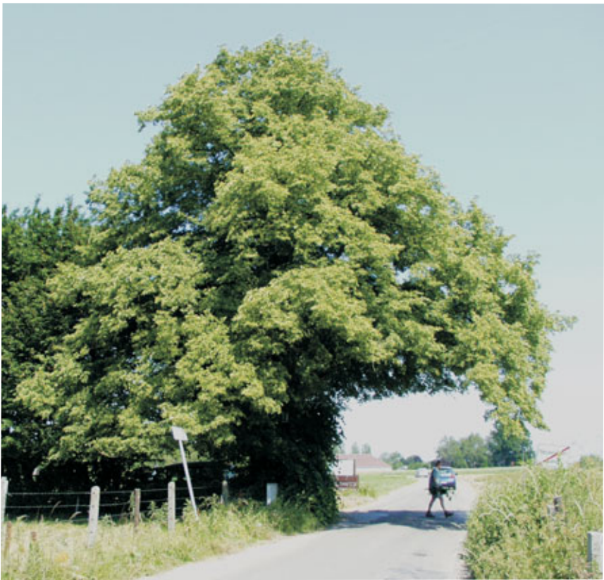
Omvangrijke winterlinde met Mariabeeldje aan rand van een oude haagbeukenhaag te Aalst.

Cultuurhistorische gebruiken kunnen karakteristiek zijn voor welbepaalde streken. Zo kunnen uitheemse soorten om cultuurhistorische redenen toch thuishoren in een specifieke regio.