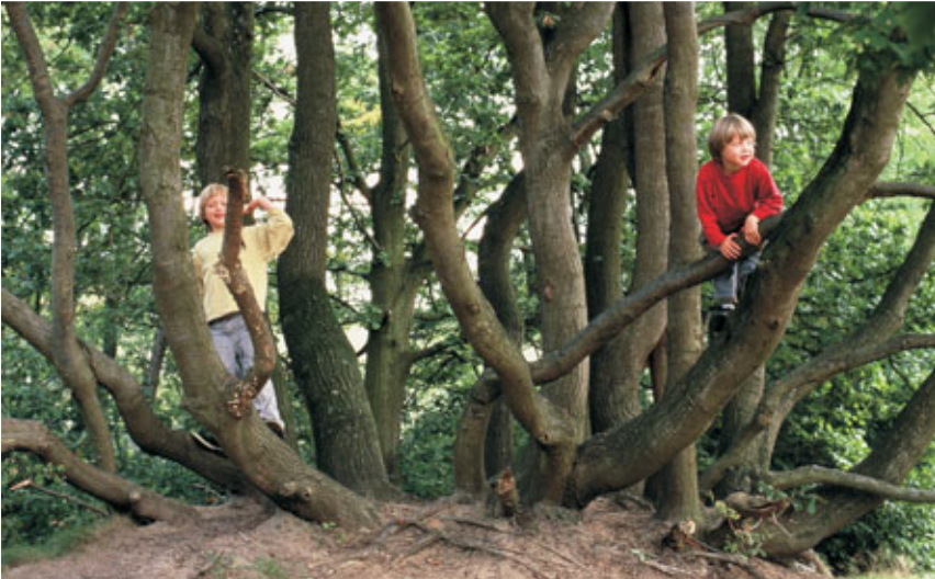
Eeuwenoude hakhoutstoof van zomereik in het Warandebos te Wetteren.

Van 1997 tot 2006 liep in opdracht van het Agentschap voor Natuur en Bos een gebiedsdekkende inventarisatie van de autochtone bomen en struiken in Vlaanderen. De bomen en struiken die werden geïnventariseerd kregen een quotering gaande van 'vrijwel zeker autochtoon' tot 'mogelijk autochtoon'. De belangrijkste criteria die bij de beoordeling van autochtoniteit gebruikt werden zijn: de ouderdom van bossen en houtkanten, de aanwezigheid van indicatorplanten voor oude bossen, de aanwezigheid van oude bomen of hakhoutstoven, het samen voorkomen van de typische waaier aan standplaatseigen bomen en struiken en uiterlijke kenmerken.