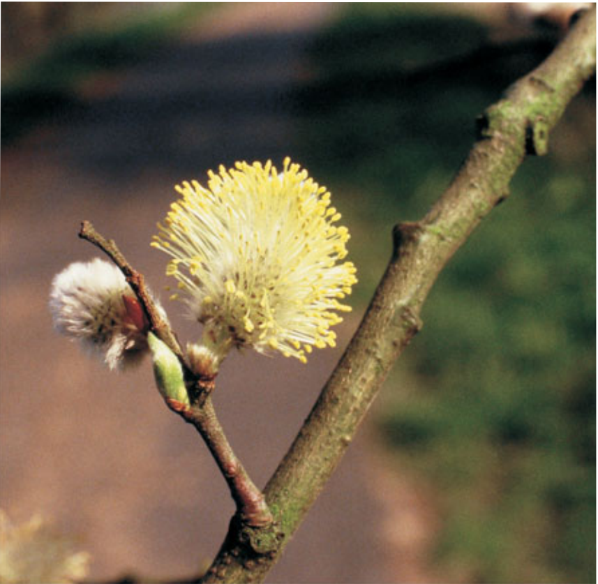
Bloeiwijze van boswilg.

Een herkomstgebied is een geografische regio waarbinnen uniforme ecologische groeicondities heersen. Er kan verwacht worden dat binnen deze herkomstgebieden de autochtone bomen en struiken aangepast zijn aan deze omstandigheden, en dat er weinig genetische verschillen zijn tussen planten van één herkomstgebied. Wanneer je autochtoon plantsoen wil aanplanten dient dit te gebeuren met plantsoen afkomstig van hetzelfde herkomstgebied als waar de aanplanting gebeurt.