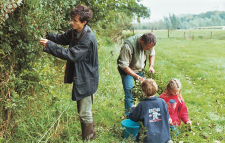
Oogsten van autochtoon zaad door vrijwilligers aan een oude bosrand.

Om aan het nodige autochtone plantsoen te geraken kan je zelf zaad oogsten. Momenteel gebeurt dit o.a. reeds door enkele Regionale Landschappen en het ANB. Ze oogsten op geïnterviewde locaties die niet erkend zijn en die dus niet op de lijst van aanbevolen herkomsten staan. Op de erkende locaties oogsten immers de kwekers. Om een oogstcampagne op poten te zetten, moet je enkele regels volgen die het ANB en het INBO in een handleiding goten ( http://contactpunt.inbo.be , doorklikken naar: autochtone bomen en struiken > plantsoen). Vervolgens laat je je plantsoen opkweken bij een privé-kweker op basis van contractteelt. Het contract verbindt je ertoe om tegen een vastgelegde prijs het plantsoen te kopen in aantallen voorzien in de overeenkomst. Gewoonlijk kan de kweker de overschotten vrij verkopen.